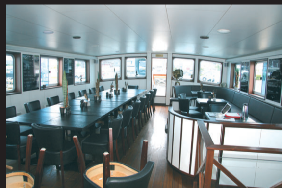
Sorte Luis er bygget i Gilleleje for 64 år siden, og er Holbæks nye Tapas- og drinksbar i den gamle havn.